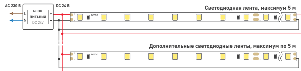
Схема 1. Подключение нескольких светодиодных лент с двух сторон