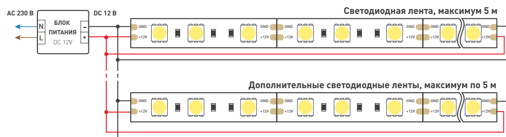
Схема 1. Подключение нескольких светодиодных лент с двух сторон