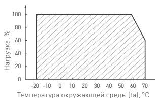
Рис. 4. Максимальная допустимая нагрузка, % от мощности источника