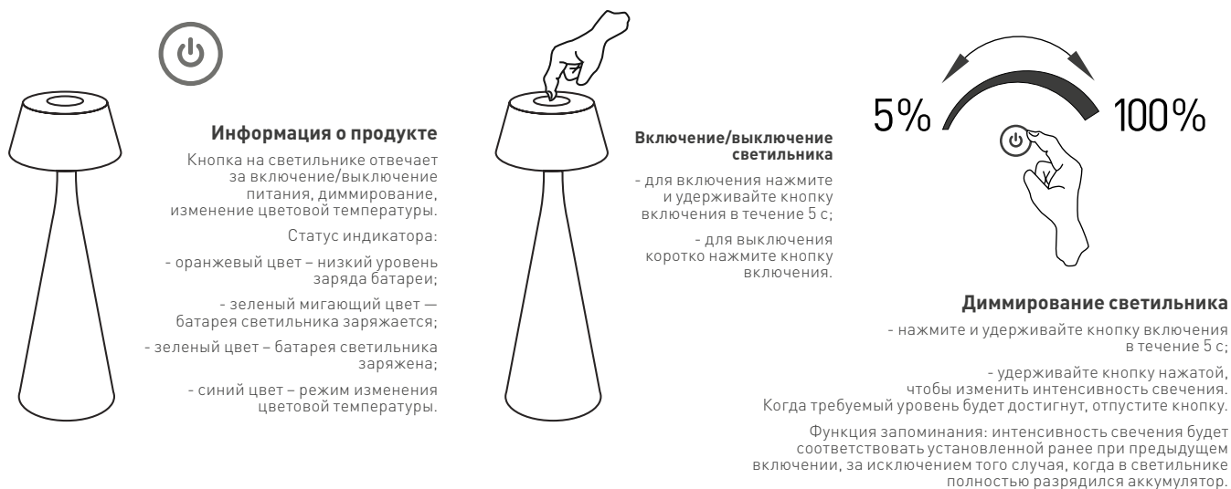
Рис. 2.1. Управление светильником